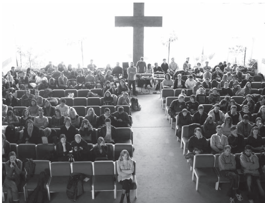
pohľad do sály