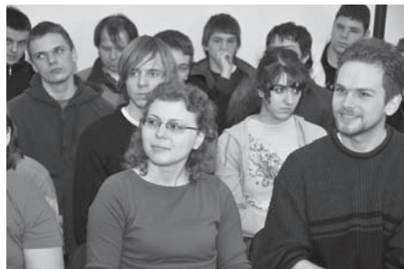
Seminár o hudbe