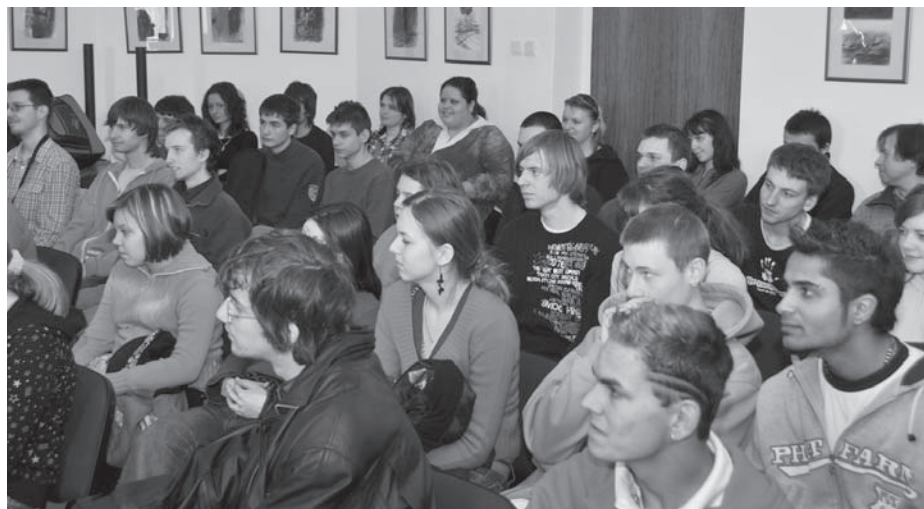
stretnutie v Starom lýceu