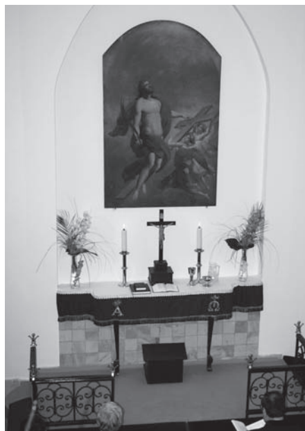
Kaplnka v EDS v lete 2007