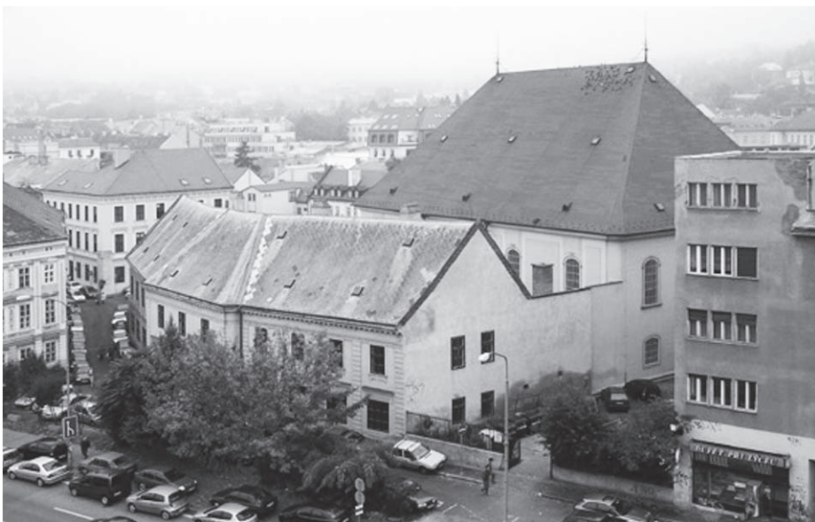
Areál Veľkého kostola s budovou Evanjelického lýcea