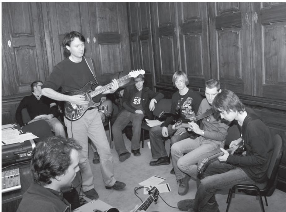
od teórie k praxi