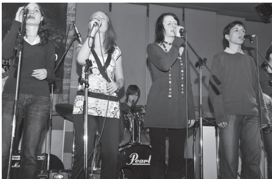
eMKo Band (BA)