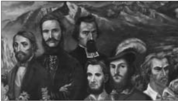
Zľava: Jozef Miloslav Hurban, Ludovít Štúr, Michal Miloslav Hodža; dolu: Janko Matuška, Janko Francisci-Rimavský, Janko Kráľ