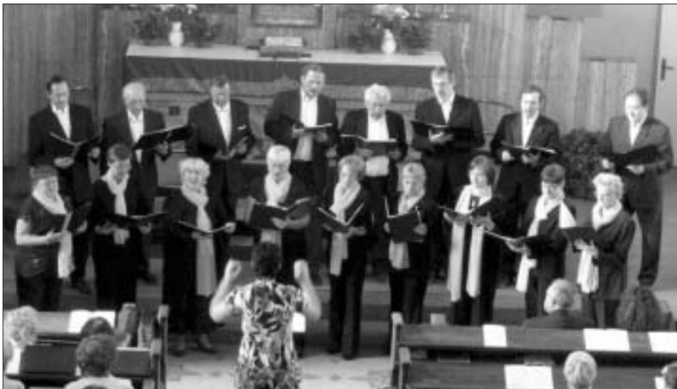
Záber je z duchovnej žatvy spevokolov nášho cirkevného zboru z júna 2009