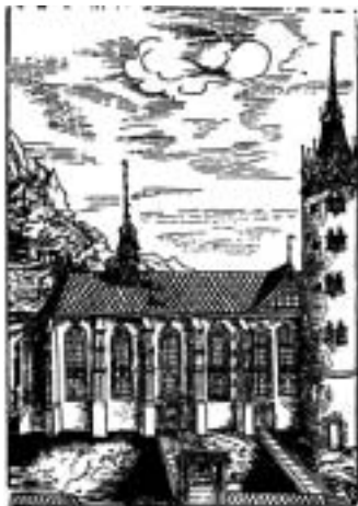
Chrám vo Wittenbergu na dvere ktorého Luther pribil svoje tézy