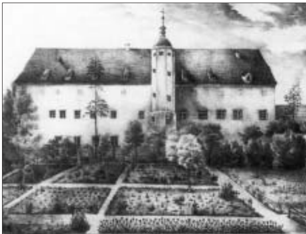
Zadná časť domu Martina Luthera vo Wittenbergu, ktorý bol predtým kláštorom

nemôže vytvoriť to, čo požaduje, nemôže pretvoriť človeka, nemôže mu darovať Ducha, ktorý by mu dal nový život. Zákon nás však privádza k takému poznaniu hriechu a seba, že sa nám v jeho svetle javí úplná jednota hriešnika a hriechu. Hriech je bytostnou časťou môjho „ja“, zákon je hranica, na ktorej sa s hriešnym človekom stretá Boh. Je to hranica smrti človeka, ktorý je celým svojim zameraním Božím nepriateľom. Luther označuje zákonom Božím poznáný a objavený hriech za dedičný hriech – hriech v jeho vzniku, v jeho pôvodnej existencii. Takto chápaný dedičný hriech nás upozorňuje, aby sme skúmali, odkiaľ vznikol hriech, kde sa rodí, čo je jeho pôvodom. Luther poukazuje, že bod, kde človek pochopí, odkiaľ sa hriech vynára, je naše vlastné ja.