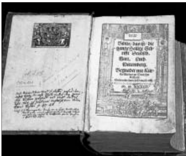
Lutherova Biblia z roku 1534

ka Kristovi má ona preň len jeden obsah. Kristus je Pánom Písma, On je ten, ktorý otvára jeho význam, On je však i ten, ktorý ho pevne určuje. Nie ľudská svojvôľa, ktorá by chcela Bibliu klerikálne alebo blúznivo vládnuť. Biblia je pre Luthera autoritou. Luther nechce hovoriť nič než to, čo počul z Písma svätého. Jeho teológia nechce byť ničím iným ako výkladom Písma. Neurobí takmer krok bez toho, aby svoje tvrdenie neodôvodnil Písmom. Luther nechce byť nič viac ako poslušným poslucháčom a žiakom Písma. A presne to isté vyžadoval od cirkvi. Cirkev môže a smie učiť a hlásať len to, čo je možné odôvodniť Písmom. Písmo má bezpodmienečnú autoritu. Na tejto pôde stojí Lutherovo učenie.