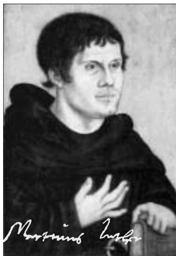
Lucas Cranach – Portrét Martina Luthera z roku 1523