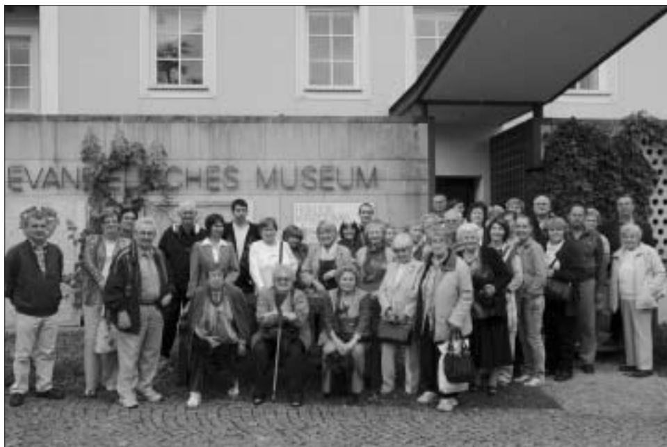
Na fotografii sú všetci účastníci zájazdu pred vstupom do múzea

v červenej farbe. Ďalšie exponáty chronologicky nasledujú v jednotlivých storočiach. Až do nástupu Adolfa Hitlera. Aj keď si verejnosť na začiatku získal, vzápätí sa veľmi rýchlo od neho odvrátili a vytriezveli z toho temného obdobia. V čiernej miestnosti zamrazí každého účastníka utrpenie, ktoré táto miestnosť vykresľuje.