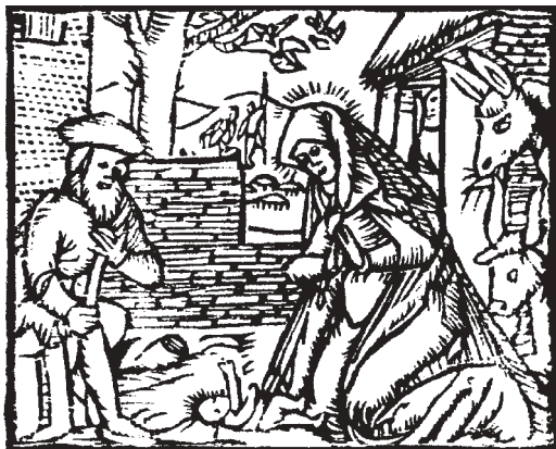
Motív z Písne Vánoční, letáková pieseň vydaná u Teslika a Neumanna v Skalici

(vo viere v tela z mŕtvych vzkriesenie a večný život sme sa s ním rozlúčili 25. 11. 2011).